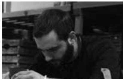
Pierre Jean LIOGIER SARL Vocanson Liogier

« Je pense que cette édition du grand prix est très intéressante, le sujet mélange tradition et innovation, technicité et réflexion. Beaucoup de travail en amont est demandé afin de se tenir prêt pour le jour J. »